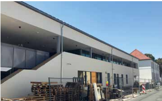
Neuer Anbau der Waldenser-Schule

Höchst erfreuliche Nachrichten gibt es aus Mörfelden-Walldorf, was den Schulbau betrifft. Der Kreis Groß-Gerau ist an allen vier Grundschulen und an der Bertha-von-Suttner-Schule tätig, um auf veränderte Rahmenbedingungen wie steigende Schülerzahlen, vermehrte Nachfrage nach Ganztagsangeboten oder Inklusion rasch zu reagieren. Er nimmt jedes Jahr viel, viel Geld in die Hand, um für optimale Lernbedingungen für die Kinder im Kreis zu sorgen. Besonders im Stadtteil Walldorf tut sich aktuell so einiges: