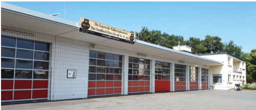
Feuerwache in Walldorf

Für den Bau einer neuen zentralen Feuerwehr mit Bauhof an der Wageninger Straße würden insgesamt knapp 15 Millionen Euro entstehen, dagegen ste-