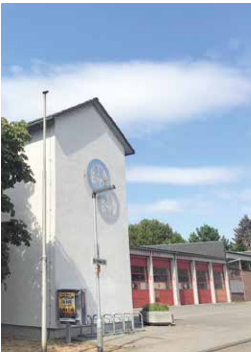
Feuerwache in Mörfelden

Auch das DRK soll an dem neuen zentralen Standort eine moderne und zeitgemäße Un-