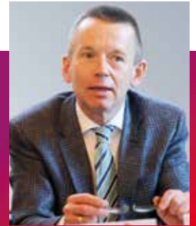
Thomas Will Landrat des Kreises Groß-Gerau

Der Kreis Groß-Gerau wird diesen Weg bei der Schulsanierung und -modernisierung, der für viele andere Landkreise