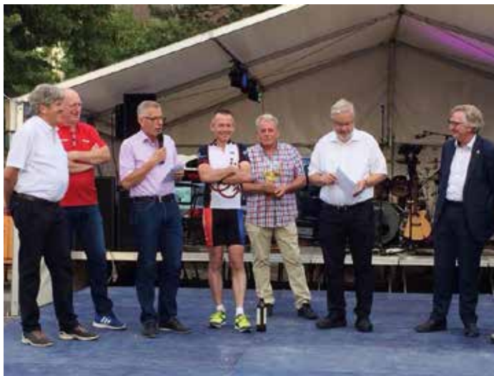
Beim Weinfest Rot-Weiß Walldorf.